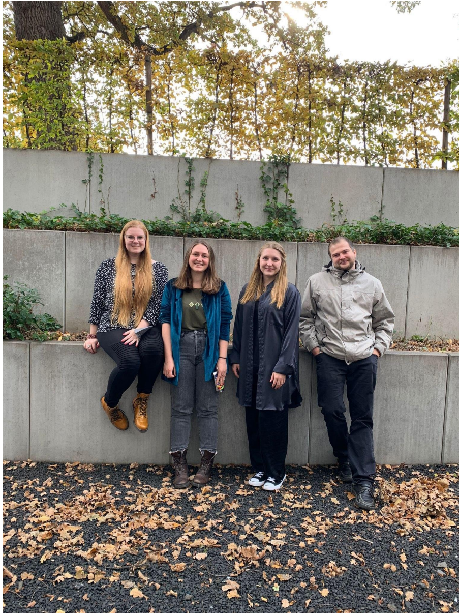
1 - Die Fachgruppe Religionswissenschaft Göttingen (wegen Corona nicht ganz vollständig)